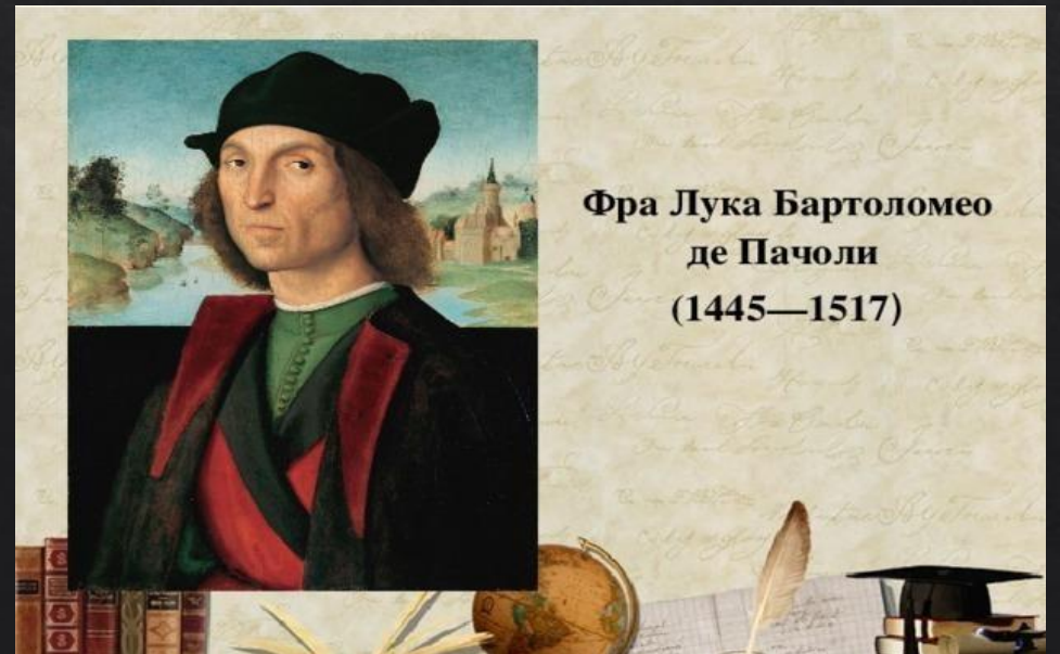
Фра Лука Бартоломео де Пачоли (1445—1517)