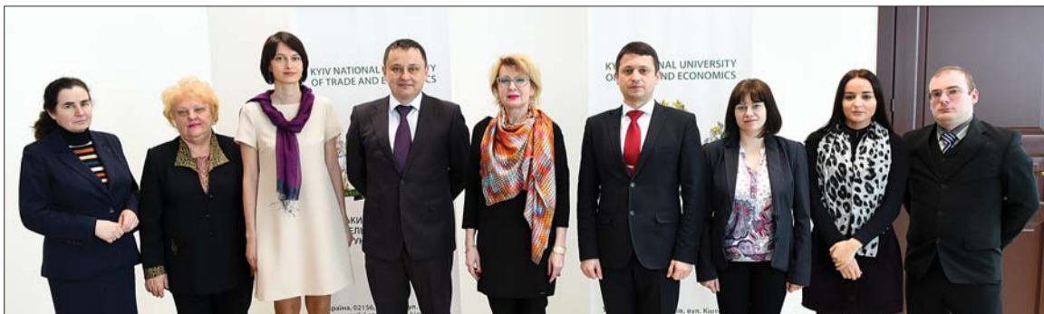
Добірку підготувала Ю. Чермерис, провідний спеціаліст відділу маркетингу і зв'язків з громадськістю

Сторони оцінили перспективи співпраці в напрямку спільної розробки навчальних програм, організації та проходження студентської практики, проведення зустрічей, семінарів і відкритих занять за участю суддів та працівників виконавчої служби.