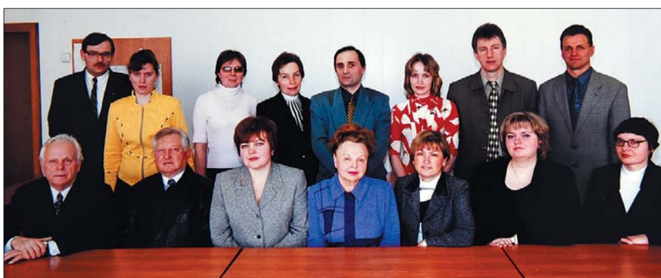
Перші співробітники кафедри зовнішньоекономічної діяльності