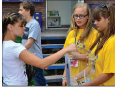
Активісти фонду за роботою