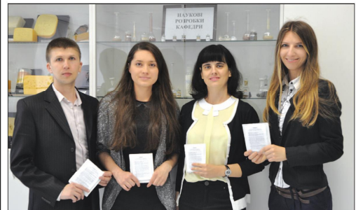
Від редакції. Зазначимо, що це не перший вияв безкорисливої допомоги колективу КНТЕУ патріотам, які важать життям заради життя держави та нації. Так, під час кривавих подій на киевському Майдані нінишньої зими для потреб потерпілих в міській лікарні передавалися необхідні ліки, постіль, кошати.