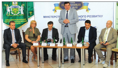
В стінах КНТЕУ традиційно відбулося засідання з нагоди Дня працівників торгівлі.