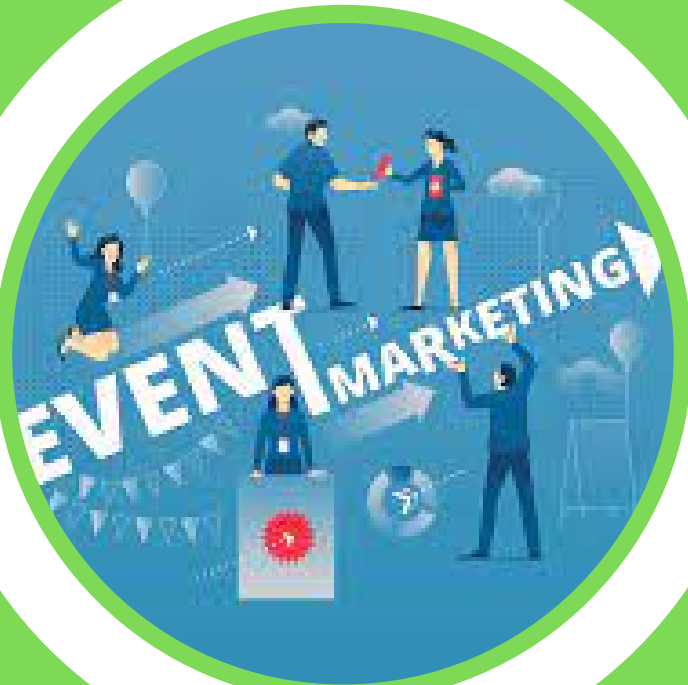
"Івент - маркетинг"