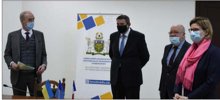
Пан посол також виступив перед франкомовними студентами і

Протягом двадцяти останніх років наш університет успішно реалізує програми подвійного дипломування разом із закладами вищої освіти Франції - Університетом Клермон-Овернь, Університетом Гренобль Альпи, Бізнес-школою «Audencia», Університетом Парі Ест Кретей та іншими. За весь час наші студенти паралельно з українськими дипломами отримали більше 100 магістерських та 250 бакалаврських державних дипломів Франції.