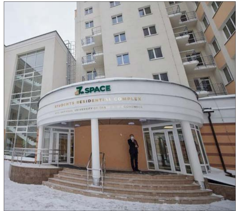
За матеріалами пресслужби Президента України, інформаційних агентств та редакції газети «Університет і час»