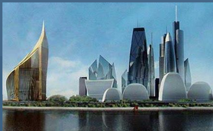
БУДІВЛІ ТА СПОРУДИ