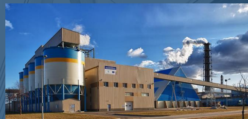
БІЗНЕС (АКЦІЇ, ЧАСТКИ)