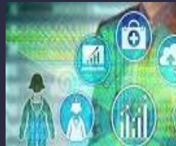
Big Data Manager/BA