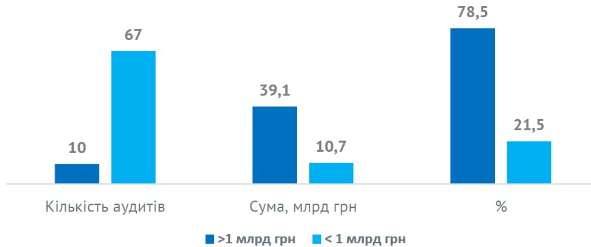
Рис. 2. Виявлені Рахунковою палатою порушення та недоліки у 2019 році більше/менше 1 млрд грн

78,5% загального обсягу порушень та недоліків, виявлених Рахунковою палатою у 2019 році (39,1 млрд грн), припадало на 10 із 77 проведених заходів державного зовнішнього фінансового контролю (аудиту).