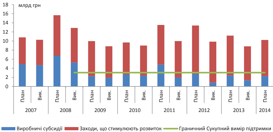
Рисунок 1: Державні витрати на програми підтримки сільського господарства та розвитку сільських територій (млрд грн.)