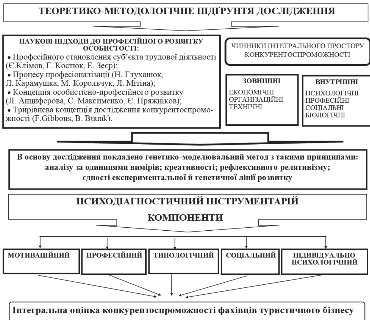
Рис. 1. Модель дослідження конкурентоспроможності фахівців туристичного бізнесу (розроблено автором)

Відповідно до мети і завдань дисертаційної роботи розроблено модель емпіричного дослідження, яка включає: теоретико-методологічне підґрунтя; наукові підходи до професійного розвитку особистості; зовнішні та внутрішні чинники КСП; психодіагностичний інструментарій дослідження, спрямований на визначення мотиваційного, професійного, типологічного, соціального, індивідуально-психологічного компонентів та її інтегральної оцінки (рис. 1).