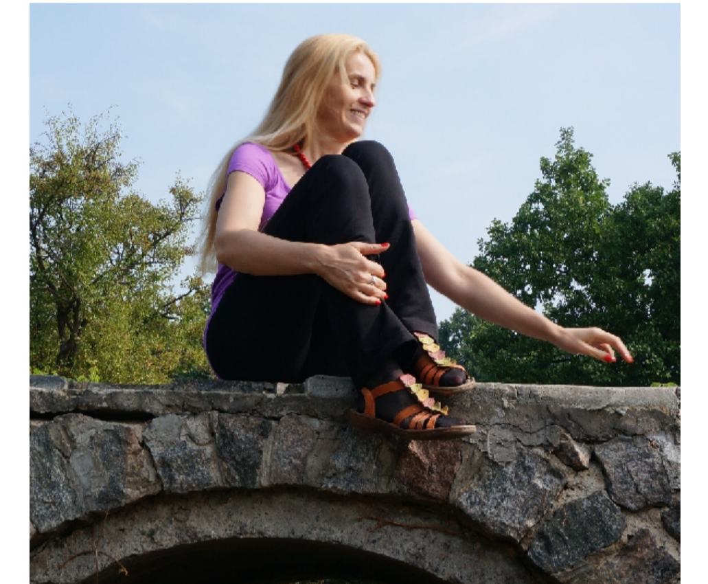
Хтось співав ...