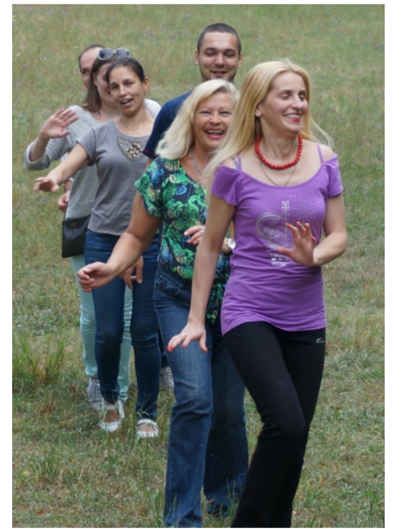
А хтось і один за одним ганявся ...