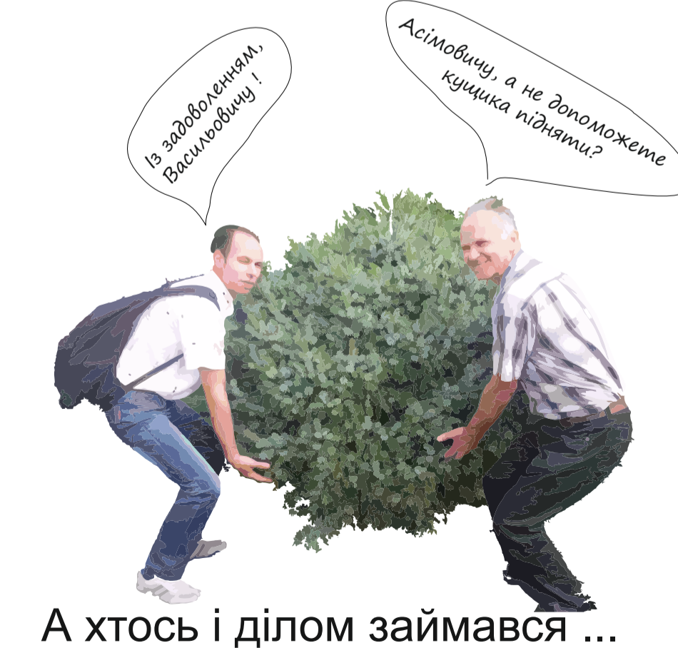
А хтось і ділом займався ...