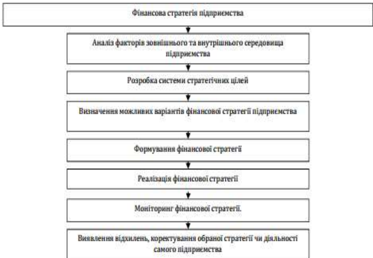
Рис. 1. Алгоритм побудови фінансової стратегії

сутність фінансової стратегії в системі менеджменту підприємства, але можливо сформувавши таке визначення категорії – комплексний план розвитку фінансової діяльності підприємства, що виражений у формуванні прибутку та його розподілу, рішеннях щодо структури капіталу, виборі форм інвестування та оптимізації оподаткування для досягнення найвищих результатів. Фінансова стратегія є основою розробки інших функціональних стратегій (маркетингової, кадрової, виробничої). Кожне підприємство має свої особливості, тому єдиного підходу щодо вибору або розробки фінансової стратегії не існує. Суб'єкт підприємницької діяльності самостійно формує таку фінансову стратегію, яка б мінімізувала ризики і сприяла збільшенню його прибутковості, підвищенню конкурентоспроможності та фінансової стійкості на ринку. Але є загальний алгоритм побудови фінансової стратегії, що відображено на рис. 1 [2, с. 162].