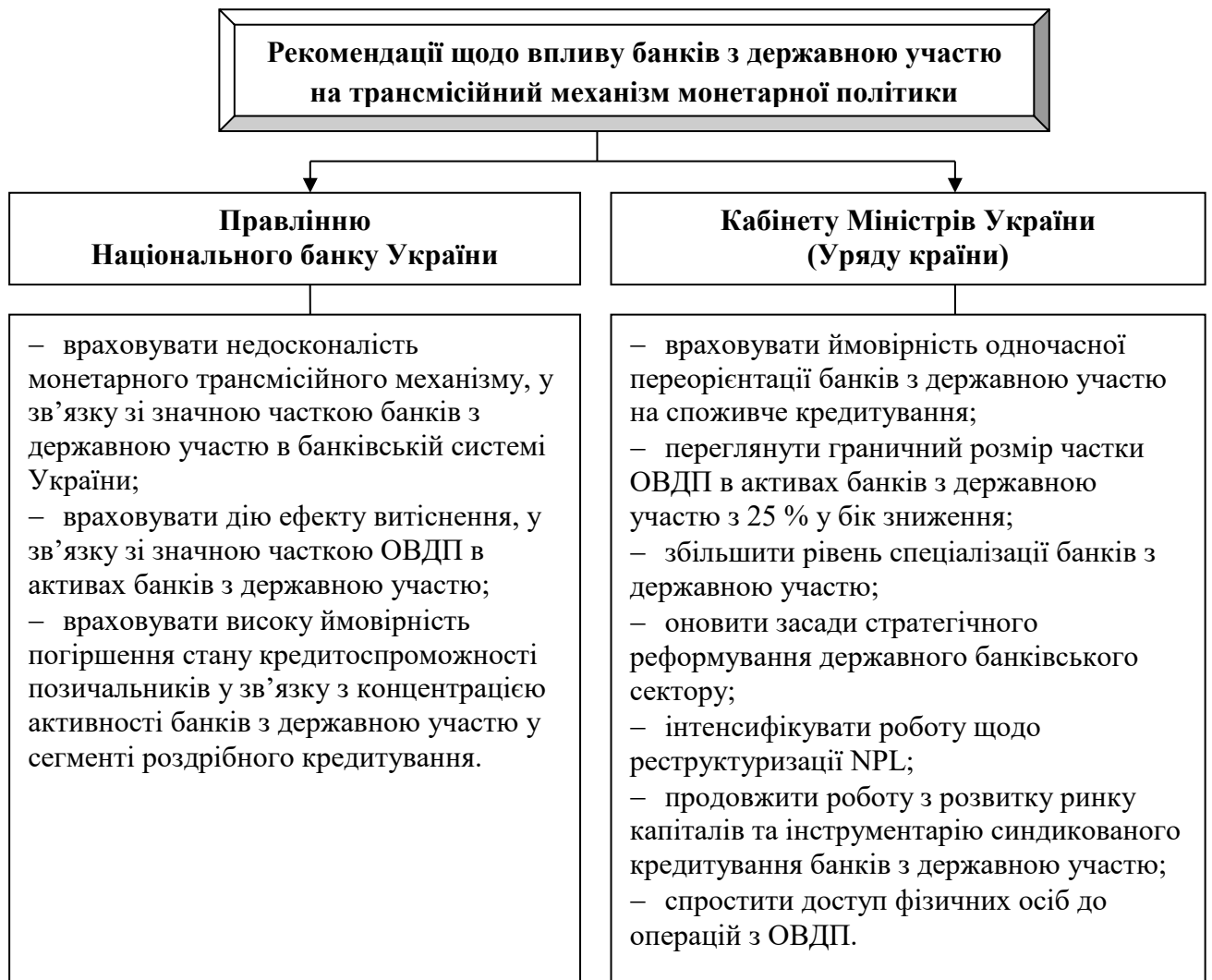
Рис. 1. Рекомендації щодо впливу банків з державною участю на трансмісійний механізм монетарної політики.