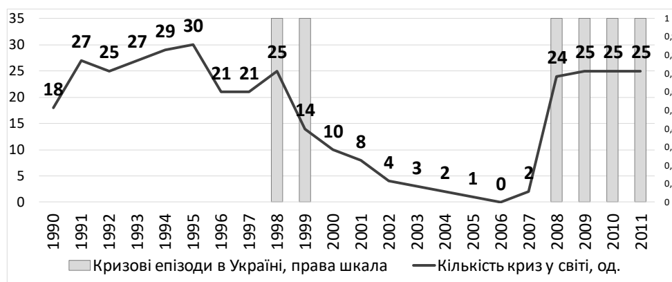
Рис. 1. Динаміка кількості системних банківських криз у світі та ідентифікація кризових епізодів в Україні в 1990-2011 рр.

Визначений вище підхід використовується фахівцями Світового банку, які наводять інформацію стосовно наявності системних банківських криз у країнах світу (рис. 1.)