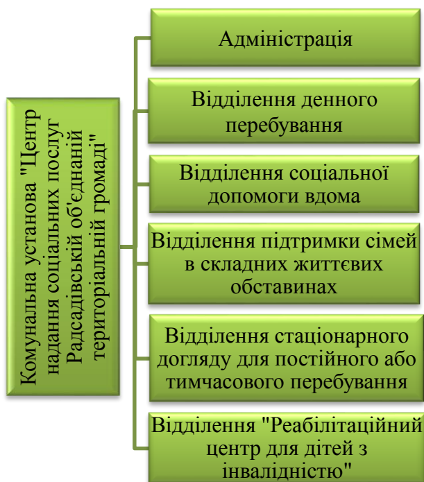
Рисунок 3.1 – Структура Комунальної установи «Центр надання соціальних послуг Радсадівській об'єднаній територіальній громаді»