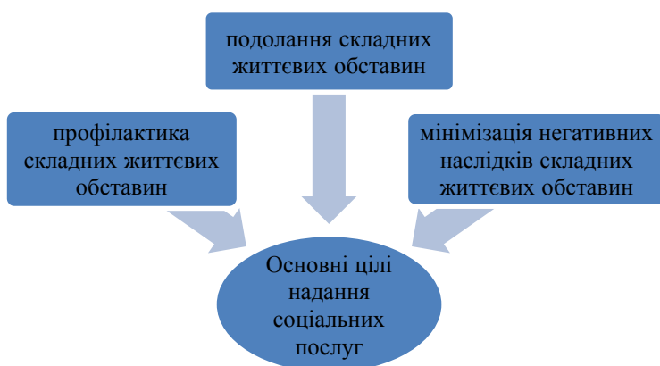
Рисунок 1.1 – Основні цілі надання соціальних послуг

Основні цілі надання соціальних послуг зосереджені на рисунку 1.1.