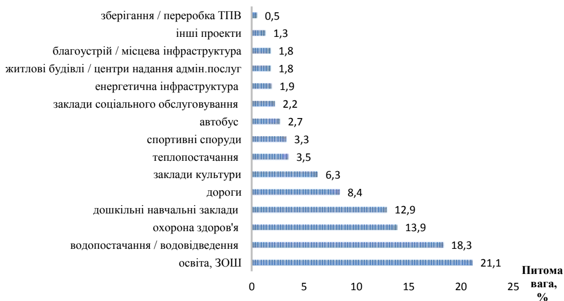
Рис. 2.2. Структура розподілу проектів, які фінансувалися з ДФРР в 2015 р. за напрямками

Так, у 2015 р. фінансування розвитку регіонів з ДФРР в 2015 р. фактично не вплинуло на їх соціально-економічний розвиток, так як було спрямовано на вирішення сьогоденних задач (рис. 2.2).