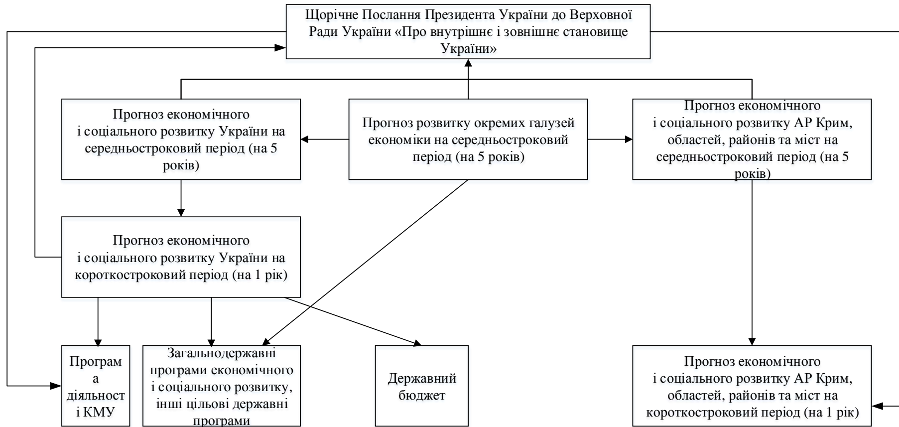
Система прогнозних і програмних документів економічного і соціального розвитку в Україні