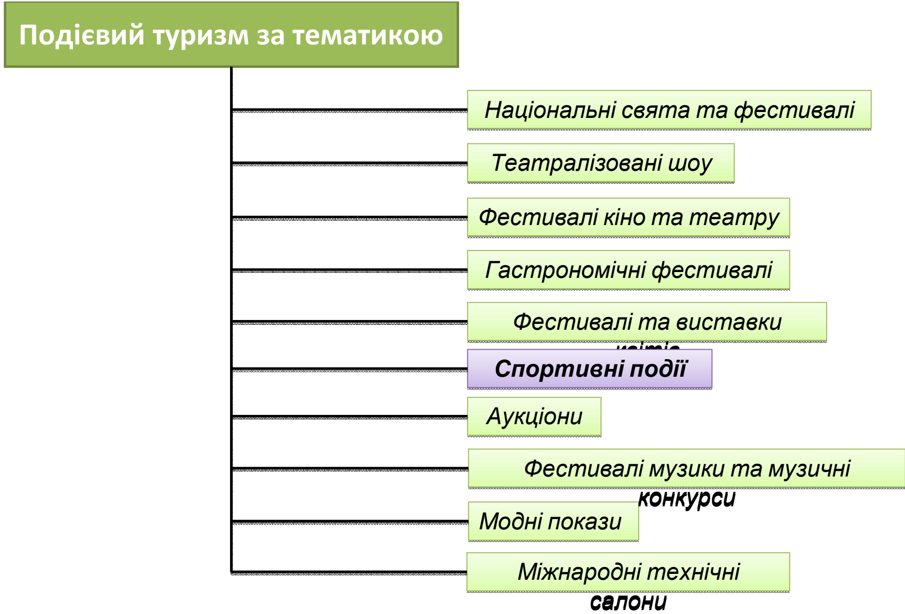
Рис.1. Місце спортивних івентів в сегменті подієвого туризму